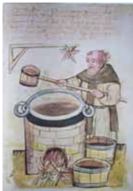
Abb. Bild eines Biermessers aus dem „Hausbuch der Mendelschen Zwölfbrüderstiftung, Blatt 125v

Das vor 500 Jahren, am 23. April 1516, vom bayerischen Herzog Wilhelm IV. erlassene Reinheitsgebot für Bier wird 2016 durch eine große Landesausstellung in Kloster Aldersbach im Passauer Land gewürdigt. Ausgehend von diesem Erlass wird Dr. Miekisch auf das Bierbrauen im Mittelalter und auf Reinheitsgebote dieser Zeit in Bayern, Franken und Thüringen eingehen.