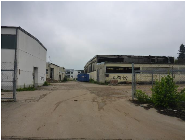
Blick von der Georg-Hemmerlein-Str. von Südosten auf das Gelände