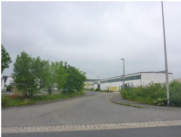
Einmündung der Georg-Hemmerlein-Straße in Gräfenberger Straße