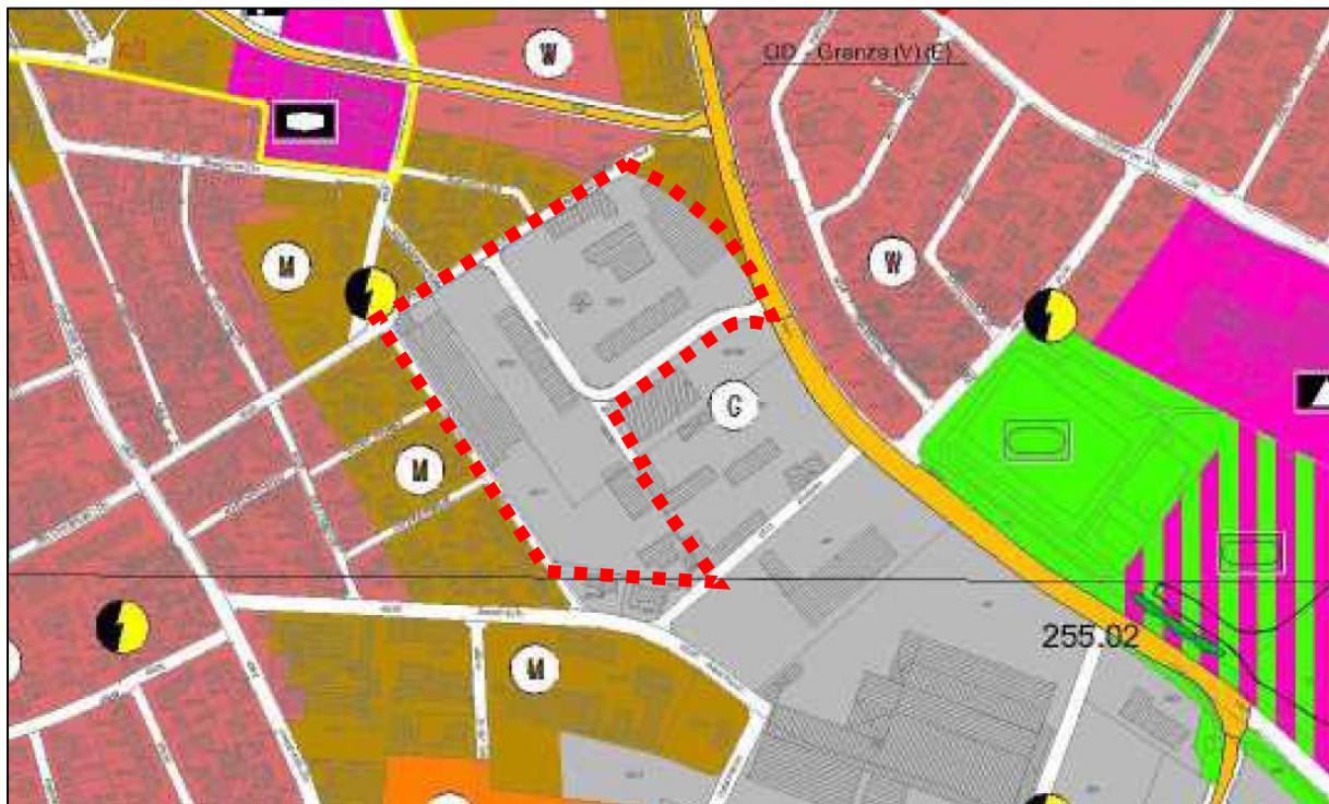
Abbildung 3: Ausschnitt aus dem wirksamen Flächennutzungsplan der Marktgemeinde Neunkirchen a. Brand (Geltungsbereich des Bebauungsplanes ist rot gestrichelt gekennzeichnet)

Im wirksamen Flächennutzungsplan der Marktgemeinde Neunkirchen a. Brand wird der Geltungsbereich des Bebauungsplanes als gewerbliche Baufläche dargestellt. Die Planung ist somit nicht aus dem Flächennutzungsplan entwickelt. Dieser ist im beschleunigten Verfahren nach § 13a BauGB im Wege der Berichtigung anzupassen.