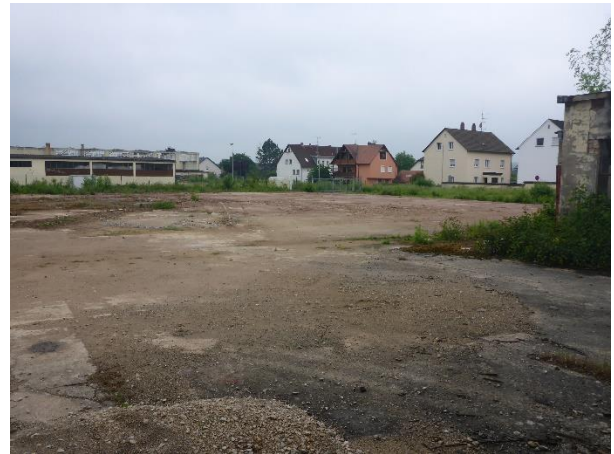
Werksgelände mit Nachbarbebauung (Blick Richtung Westen)