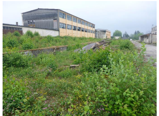
Südlicher Teil des Werksgeländes (Blick Richtung Südosten)