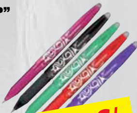
PILOT Tintenschreiber Frixion verschiedene Farben