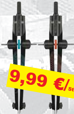
FABER CASTELL Schnellverstellzirkel "Twister" verschiedene Farben