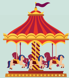
Für die kleinen Gäste Karussell am Zehntspeicherplatz.

... und vieles mehr bietet „Unser Budenmarkt“