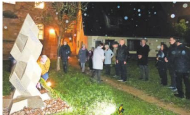
Einen Stein zum Gedenken an die ermordeten jüdischen Ermreuther legten die Besucher der Gedenkveranstaltung zur Reichspogromnacht 1938 an der Stele vor der Synagoge nieder.

Nach der Machtergreifung durch die Nazis gelang es einigen noch Deutschland zu verlassen. Zwölf Personen, darunter zwei Kinder, lebten noch 1941 im Ort, während eine etwas größere Gruppe in Judenhäuser in Nürnberg verbracht worden war. Für sie alle führte der Weg nach Osten in Konzentrati-