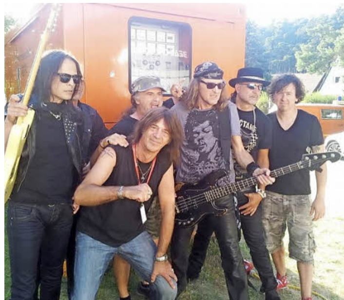
Die Plakate und Fotos jener Stars, die zwischen 1978 und 1988 in der Neunkirchner Hemmerleinhalle auftraten, werden heute für teures Geld bei eBay gehandelt.