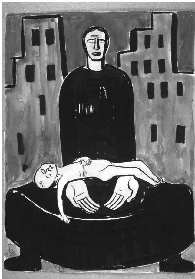
Mutter mit totem Kind Aquarell, Oktober 1943

Katholisches Pfarrgemeindehaus Adolf Kolping Neunkirchen am Brand Sonntag, 26. September 2004, 19.00 Uhr