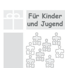
Evangelischer Kinderhort Hochstr. 4