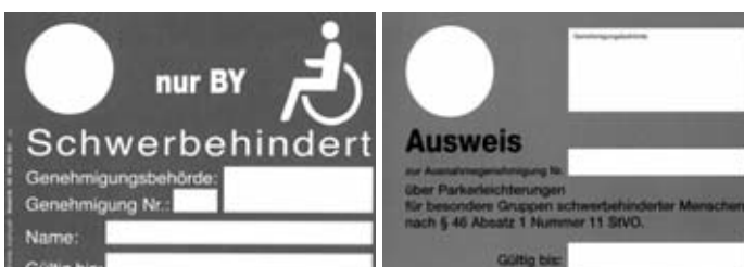
Rückseite des BY-Ausweises