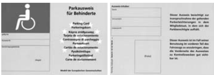
Vorderseite des BY-Ausweises