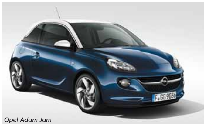
Opel Adam Jam

Für Ihr leibliches Wohl ist bestens gesorgt.