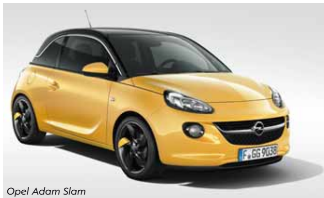
Opel Adam Slam

Kreieren Sie Ihren eigenen Style. Unkonventionell, modisch, mit coolen Farbkombinationen als ADAM JAM. Glamourös und chic als ADAM GLAM. Sportlich und impulsiv als ADAM SLAM.