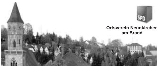
Ortsverein Neunkirchen am Brand