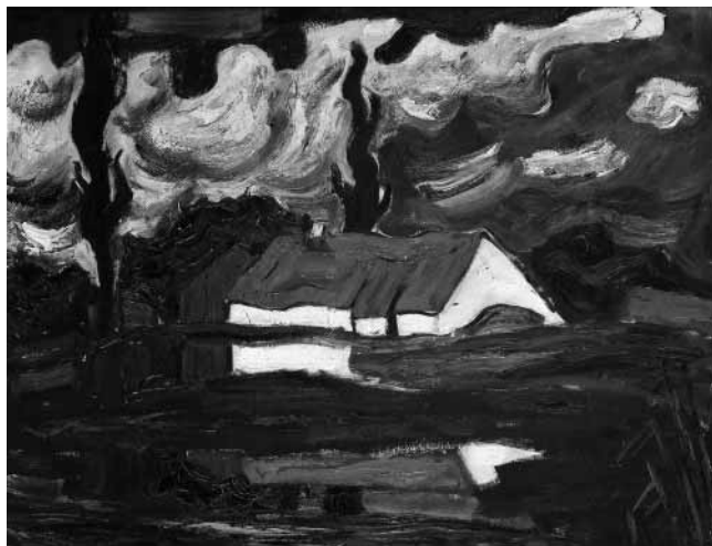
Felix Müller: Der Wittinghof bei Langenzenn, um 1934

- Eine Veranstaltung im Rahmen der Kulturtag 2013 -