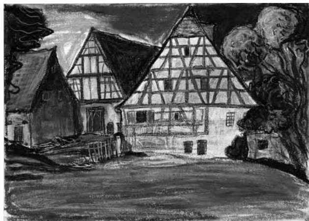
Heinersdorfer Mühle bei Laubendorf

Aus seinem reichhaltigen Bestand und ergänzt durch Leihgaben zeigt das Museum bis Ende September 2013 unter dem Titel "Fränkische Kulturlandschaft" eine neue Sonderausstellung mit Werken des Künstlers.