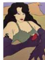
Sharon Ventura, Eve of Seduction

Öffentliche Führungen jeweils samstags und sonntags um 16 Uhr sowie nach Vereinbarung (Anmeldung im Evang.-Luth. Pfarramt: Tel. 09134-883)