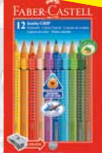
FABER CASTELL Farbstifte "Jumbo GRIP" inkl. Spitzer, 12er-Kartonetui