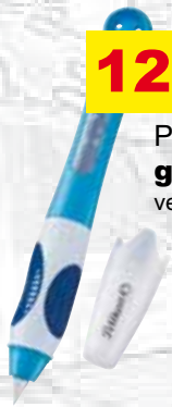
Pelikan grifix-Füller verschiedene Farben