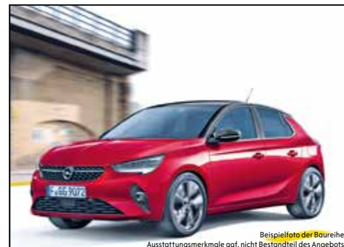
Beispielfoto der Baureihe. Ausstattungsmerkmale ggf. nicht Bestandteil des Angebots.