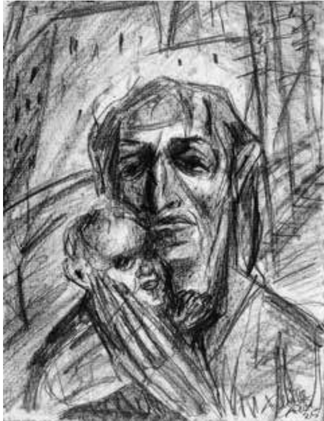
Mutter mit Kind, Bleistift, 1925.