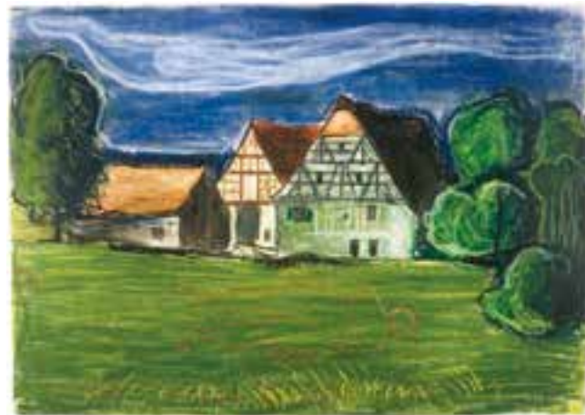
Ölkreide „Heinersdorf Gretel“

Er ist auch später immer mal wieder nach Laubendorf gefahren, denn dort war das Grab seiner Eltern. So auch am 25. August 1973. An diesem Tag entstehen drei Ölkreidezeichnungen der Heinersdorfer Mühle. Auf einer der Zeichnungen liegt in der Wiese vor Mühle – silhouettenhaft angedeutet - ein nacktes Weib, und über der Mühle schwebt eine Wolke in menschlicher Gestalt.