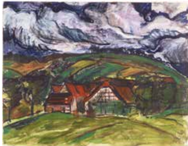
„Die Mühle“ bei Heinersdorf, Mischtechnik, August 1928