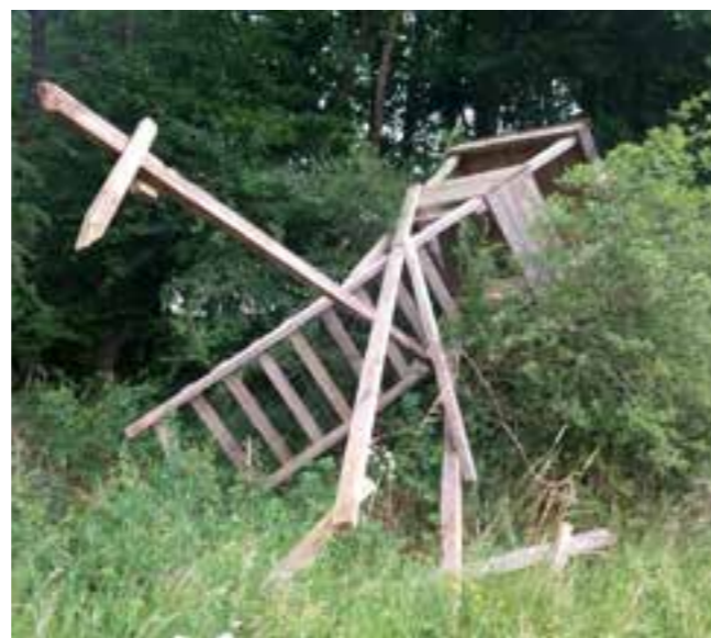
Zerstörte Ansitzkanzel zwischen Kleinsendelbach und Großenbuch

Die Jägerinnen und Jäger von den Revieren um den Hetzleser Berg.