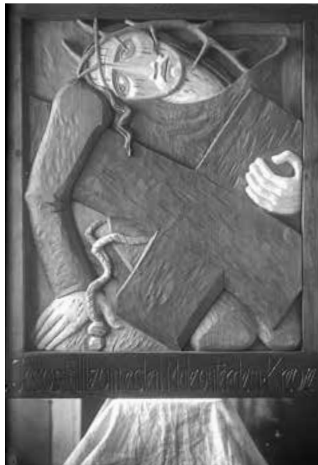
Kreuzweg Spielberg, 3. Station, 1932

Sein Kreuzweg für das Kirchlein St. Wendelin in Spielberg