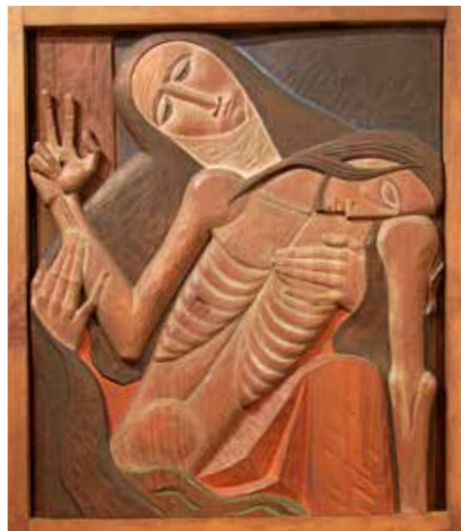
Kreuzweg Spielberg, 13. Station, Zweitfassung nach 1950

aus dem Jahr 1932 wird in der Ausgabe des „Völkischen Beobachter“ vom 10.3.1937 als „Kirchenschändung“ und „bolschewistische Schreckbilder“ diffamiert. Weiter heißt es: „Darum müssen die grellfarbigen Holzreliefs in ihrer epileptischen Ekstase wie ein Keulenschlag auf die überkommene Vorstellungswelt der einfachen Waldbauern wirken“. Seine Reaktion auf diesen Artikel in einem Brief an den Freund Karl Schwab: „Die nächste Instanz wird Dachau sein. Aber ich gehe meinen Weg.“