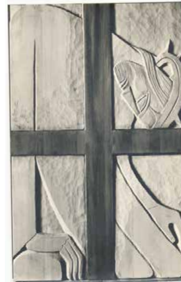
Kreuzweg Großenbuch, Station 7, 1968