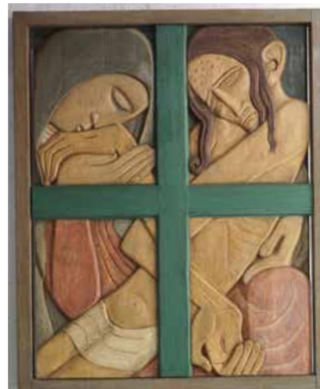
Kreuzweg Langenzenn, 13. Station, 1951/1952